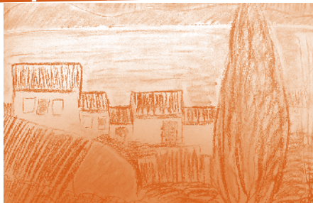
Etang de Gruissan, vue de la tour Barberousse Fusain de Coralie