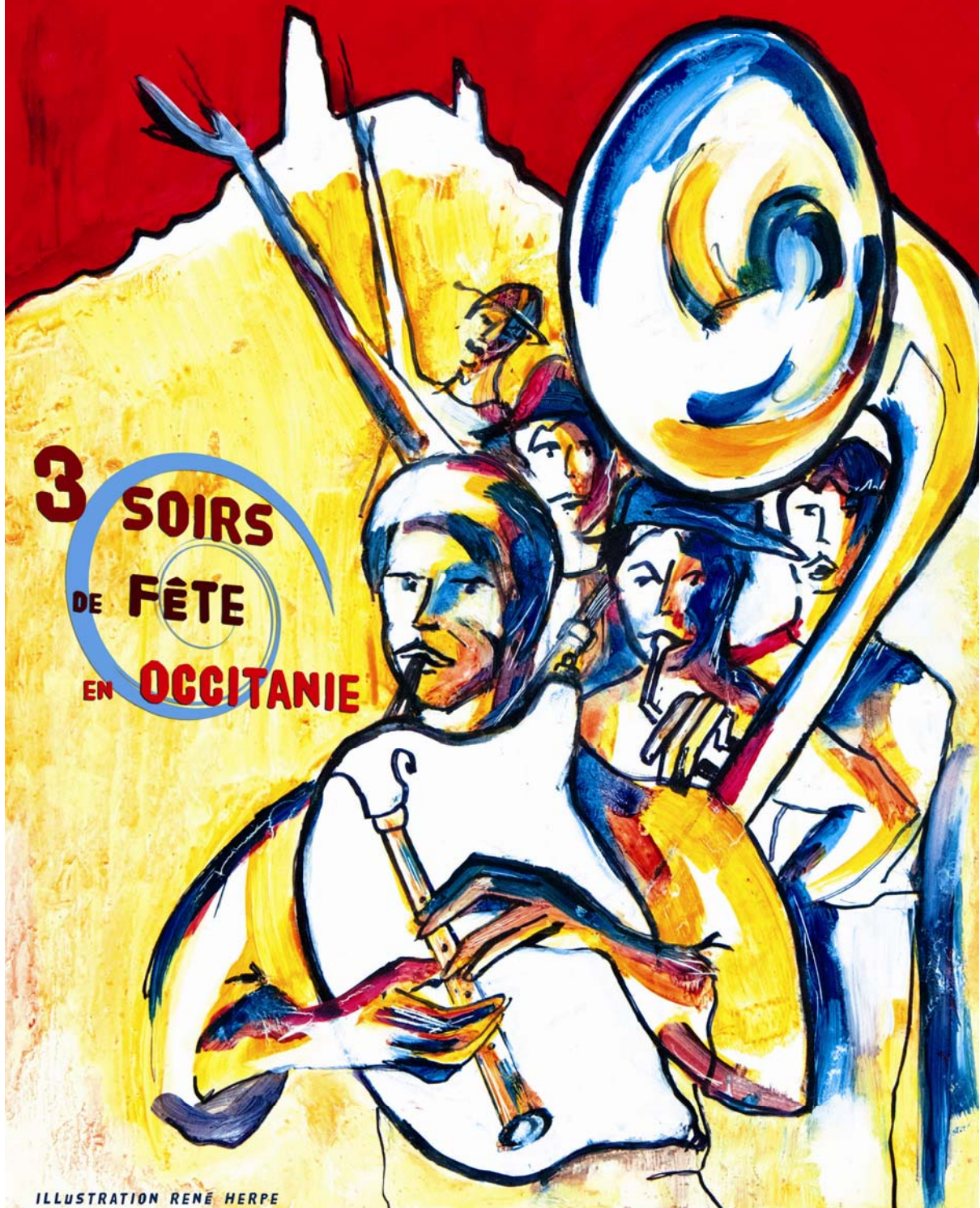
ILLUSTRATION RENÉ HERPE