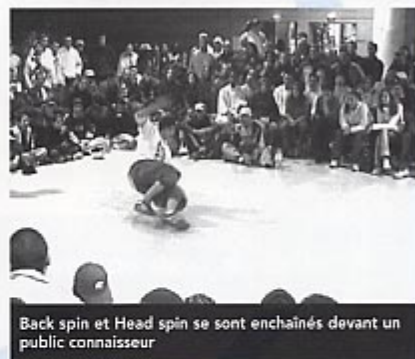
Back spin et Head spin se sont enchaînés devant un public connaisseur

Cette manifestation fut l'occasion de créer une synergie puisque les adolescents du