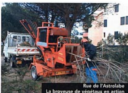
Rue de l'Astrolabe La broyeuse de végétaux en action