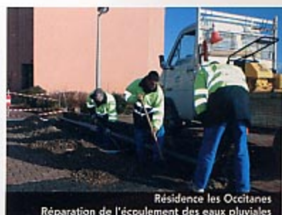
Résidence les Occitanes Réparation de l'écoulement des eaux pluviales