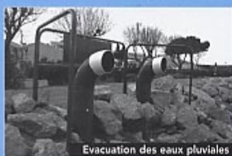
Evacuation des eaux pluviales