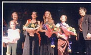
Élection de Miss Carnaval