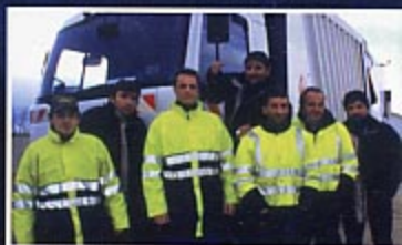
L'équipe de ramassage des déchets ménagers