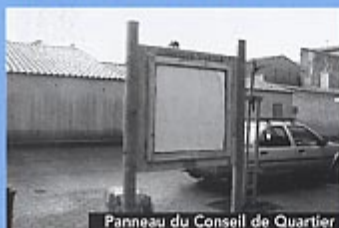
Panneau du Conseil de Quartier