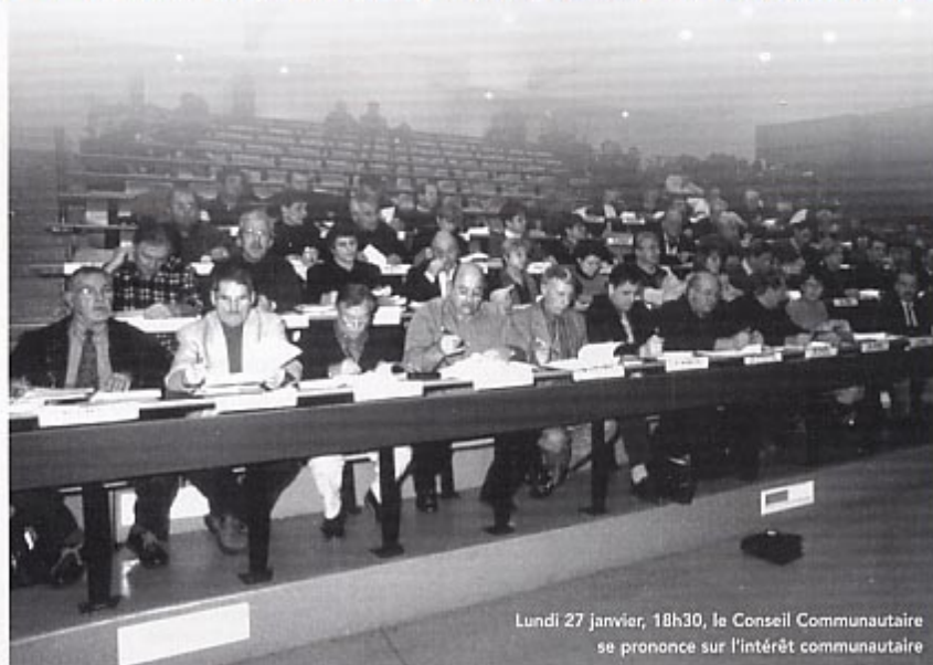
Lundi 27 janvier, 18h30, le Conseil Communautaire se prononce sur l'intérêt communautaire