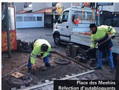
Place des Menhirs Réfection d'autobloquants