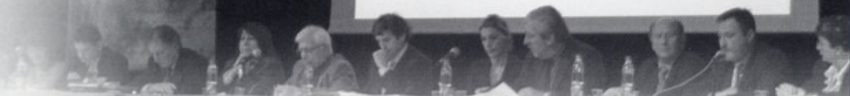
▲ Une équipe municipale organisée et à l'écoute.

de nos... pour équiper Gruissan Fonctionnement 11 535 000 € soit 46,61% du budget Investissement 13 212 000 € soit 53,39% du budget