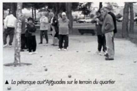
▲ La pétanque aux Ayguades sur le terrain du quartier

N'hésitez pas à aller encourager votre équipe et même à prendre part au tournoi qui reste ouvert à tous !