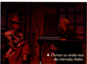
▲ L'humour au rendez-vous des intermèdes théâtre.