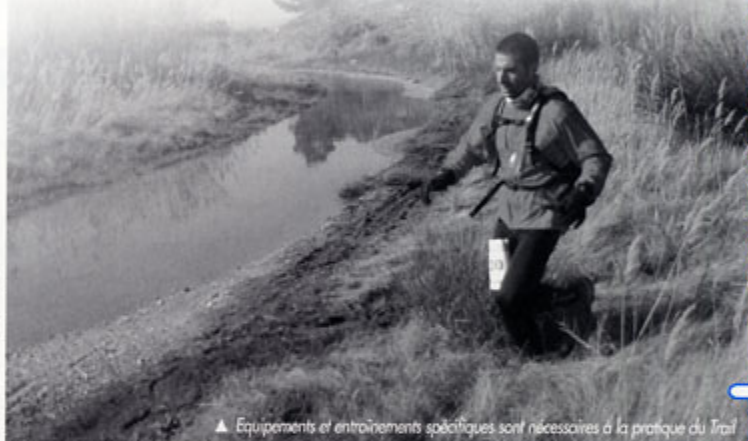
▲ Equipements et entraînements spécifiques sont nécessaires à la pratique du Trail

Autour d'un événement d'une telle ampleur c'est une grande équipe de bénévoles et de passionnés qui s'active pour offrir à chacun une belle course. Nous citerons la MJC et la section des Bucadels, chef d'orchestre de ce rendez-vous. De nombreux partenaires soutiennent cet événement sportif à présent incontournable.