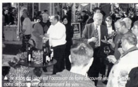
▲ Le salon de Liège est l'occasion de faire découvrir les vins de notre département et notamment les vins

Ce salon, fréquenté par plus de 50 000 visiteurs, permet au tourisme audois d'entretenir une clientèle fidèle et de faciliter les contacts avec un marché potentiel très