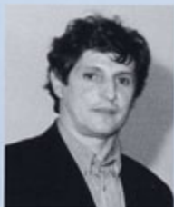
Madame, Mademoiselle, Monsieur, Chers amis,

Imprimerie : Imprimerie de bourg (Narbonne)