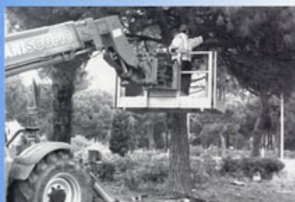
▲ Entrée de la station : élagage, nettoyage et plantation de massifs de fleurs aux espaces verts

De nombreux Gruissanais, tous quartiers et toutes générations confondus partagent le plaisir de parties de pétanque à travers les équipes représentant chacun des 11 quartiers.