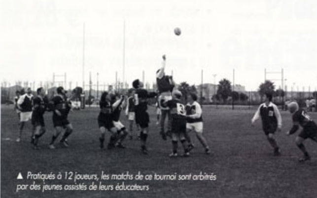
▲ Pratiqués à 12 joueurs, les matchs de ce tournoi sont arbitrés par des jeunes assistés de leurs éducateurs

Samedi 4 mars, Gruissan accueillait le tournoi du Languedoc des moins de 15 ans.