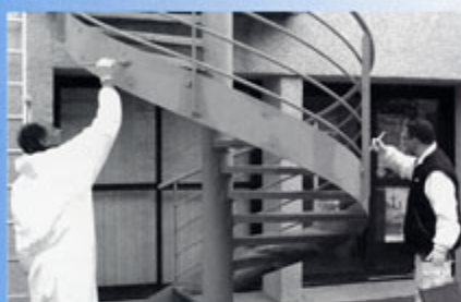
▲ Espace Socioculturel : rafraîchissement des peintures extérieures