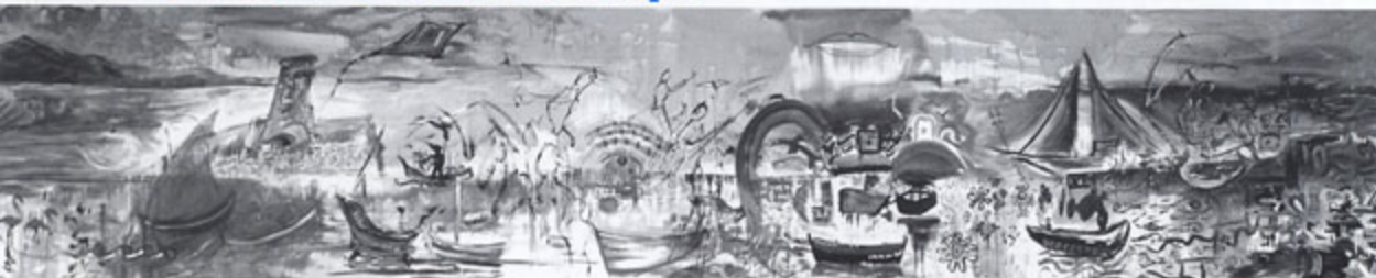
▲ Fresque murale réalisée par les artistes et les visiteurs

Cette quatrième édition du Printemps des Sens avait pour thème « la vue et la peinture ». L'affiche de l'événement annonçait la couleur : un feu d'artifice d'émotions printanières. Toujours basé sur la découverte de notre patrimoine culturel, naturel et humain par les 5 sens, ce festival a donné place aux créations artistiques.