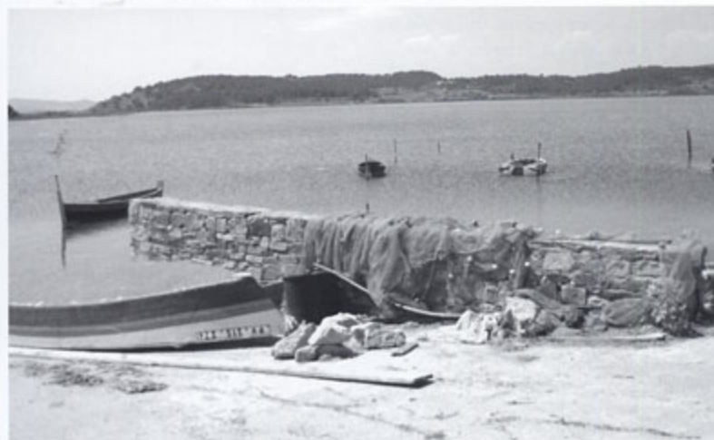
Le PLU, c'est créer une harmonie entre les nouvelles constructions et les traditions

Les permis de construire pourront être délivrés au printemps 2007.