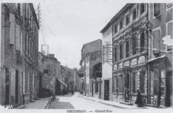
GRUISSAN. — Grand'Rue

▼ Entre le début du siècle et nos jours les besoins urbanistiques ont changé