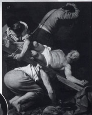
▲ Caravage, La Crucifixion de St Pierre, 1600-1601, Rome Santa Maria del Popolo

Caravage est un artiste violent et rebelle. Il a vécu à un moment capital de l'histoire pendant lequel des tragédies, des contrastes sociaux, religieux et intellectuels, des changements politiques et économiques ont changé la face du monde. Avec une personnalité comme la sienne, l'homme de la Renaissance prend