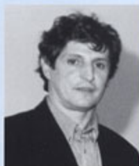
Madame, Mademoiselle, Monsieur, Chers amis,

Imprimerie : Imprimerie de boug (Narbonne)