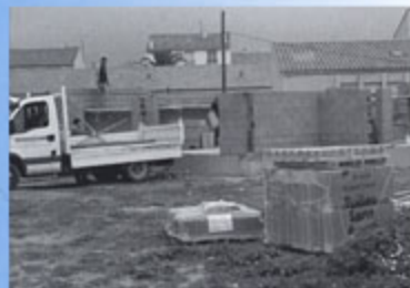
▲ Ecoles : construction de nouveaux bâtiments Montant des travaux : 299 180 €