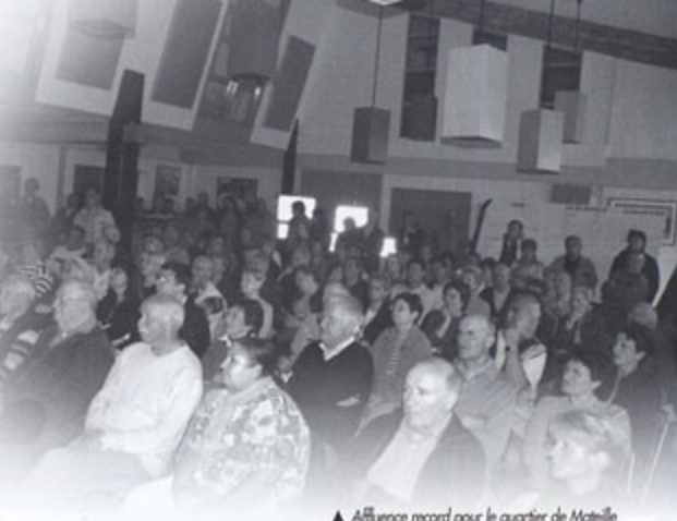
▲ Affluence record pour le quartier de Mateille

Sur tous ces points, les élus apportèrent des réponses précises et motivées.