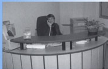
▲ Mairie : nouvel accueil plus convivial qui fait la part belle à l'ergonomie du poste de travail