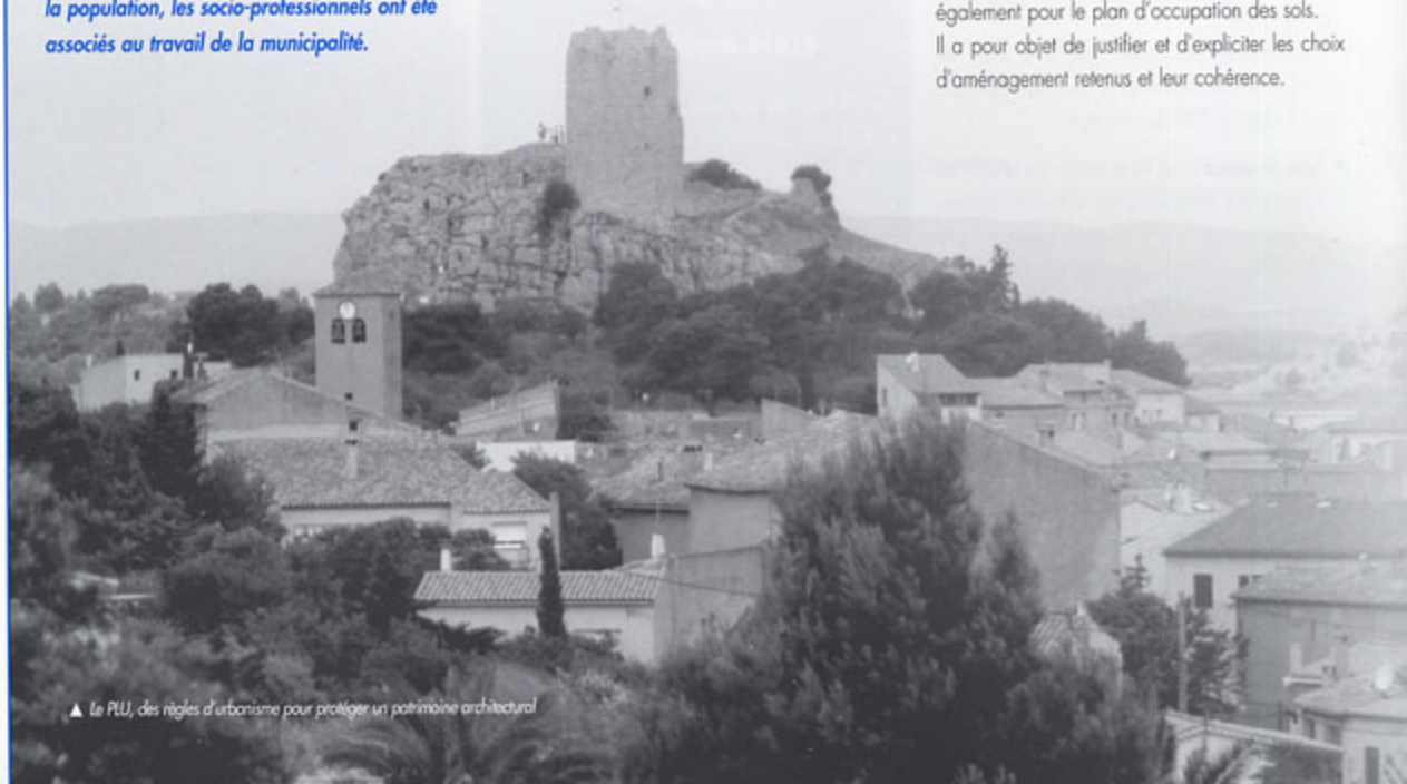
▲ Le PLU, des règles d'urbanisme pour protéger un patrimoine architectural

C'est là le document important, comme il était également pour le plan d'occupation des sols. Il a pour objet de justifier et d'explicitier les choix d'aménagement retenus et leur cohérence.