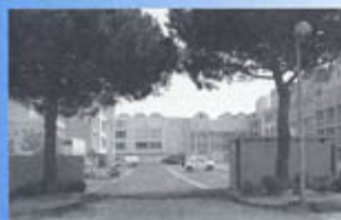
▲ Port-Rive - Droite : réfection de l'entrée de la résidence la Voie d'Or