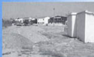
▲ Chaleis : agrandissement du parking d'entrée pour faciliter l'accès aux commerces