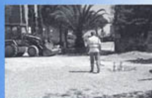
▲ Moteille : réfection de la voirie avenue de la Pérouse