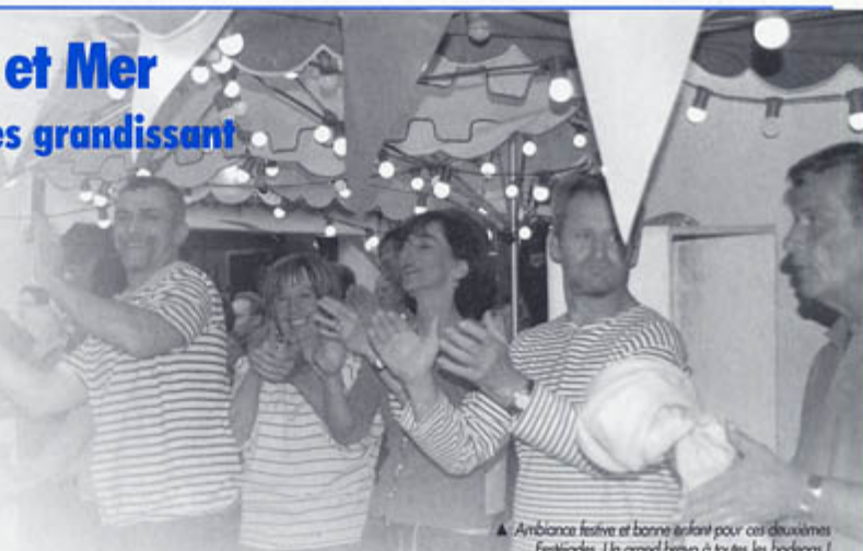
▲ Ambiance festive et bonne ambiance pour ces deuxièmes Festjades. Un grand bravo à toutes les bodegas !

La mobilisation et l'investissement importants des associations derrière les bodegas sont essentiels à la réussite d'un tel événement. Patilla, tapas, plancha, huîtres, escargots, anchois... tant de saveurs