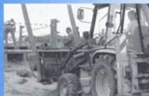
▲ Chaleis : changement du ponton n°1