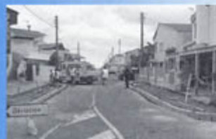
▲ Chaleis : mise en place de parking, réfection de la voirie, plantations de palmiers