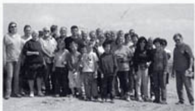
▲ Une belle équipe d'amoureux de la nature propre sur la plage de la Vieille Nouvelle

En fin de matinée, au musée des salins, un nouveau bail a été signé entre la Ville de Gruissan et la Compagnie des Salins. Il évite ainsi l'abandon du site par la Compagnie et une prise en charge