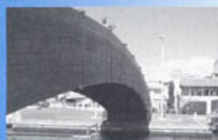
▲ Port : travaux pour renforcer la passerelle