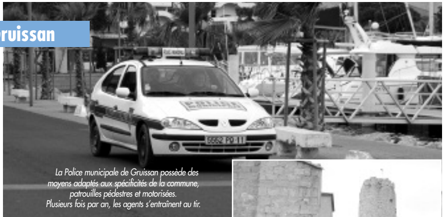
La Police municipale de Gruissan possède des moyens adaptés aux spécificités de la commune, patrouilles pédestres et motorisées. Plusieurs fois par an, les agents s'entraînent au tir.