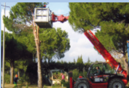
Port Rive Gauche : élagage des pins