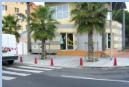
Office de Tourisme : installation de bornes