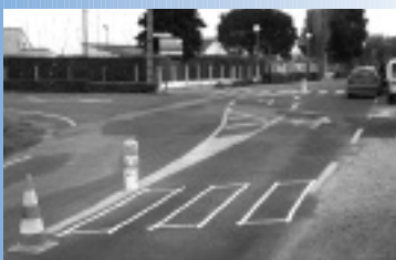
▲ Route de Tournebelle : matérialisation d'un passage piéton

La circulation sur ces deux rues ayant fait l'objet de nombreuses fiches de quartier de la part des riverains, une réflexion s'est engagée pour tenter de trouver une solution satisfaisante.