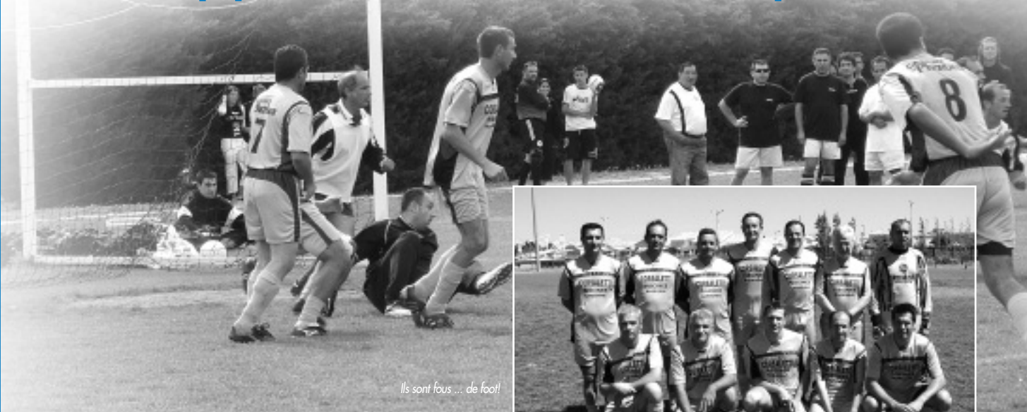
Ils sont fous... de foot!

Gruissan, terre de rugby, est aussi désormais un lieu d'intense activité footballistique avec nombre d'équipes de tous âges. Depuis l'année 2000, d'anciens joueurs, des parents de jeunes footballeurs et des dirigeants du Gruissan Football Club prenaient pour habitude de se retrouver le lundi soir pour « taquiner la balle » comme on dit chez nous. L'équipe des Vétérans de l'Olympique de Mateille prenait naissance au sein de la MJC dans l'amour du ballon et la convivialité. Le plaisir de se retrouver et de partager de bons moments de football (et de 3 ème mi-temps bien sûr) ont fait que l'effectif n'a cessé de croître.