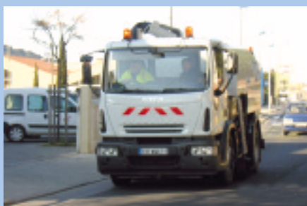
Voie : une nouvelle balayeuse