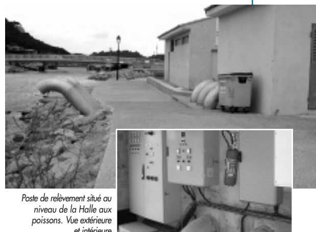
Poste de relèvement situé au niveau de la Halle aux poissons. Vue extérieure et intérieure

De plus, ces pompes sont alimentées par des groupes électrogènes en cas de coupure électrique. Le dernier poste, installé à la Halle des pêcheurs, bénéficie d'une 3 ème pompe afin d'améliorer l'évacuation. Par ailleurs, ces installations nécessitent des vérifications fréquentes de l'état de fonctionnement. Ces contrôles sont couplés avec le débouchage régulier des avaloirs (grilles d'évacuation des eaux pluviales). ■