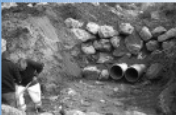
▲ Clos de l'Estret : réfection des buses et de la martelière