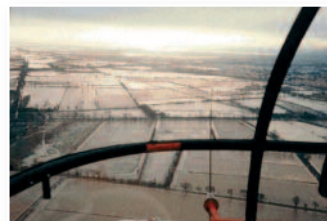
Inondation des Basses Plaines de l'Aude.

Ces phénomènes sont en étroite interaction les uns avec les autres. Les secteurs localisés à proximité des différents étangs sont sensibles, tout comme une importante partie du centre historique ainsi que la plage des Chalets.