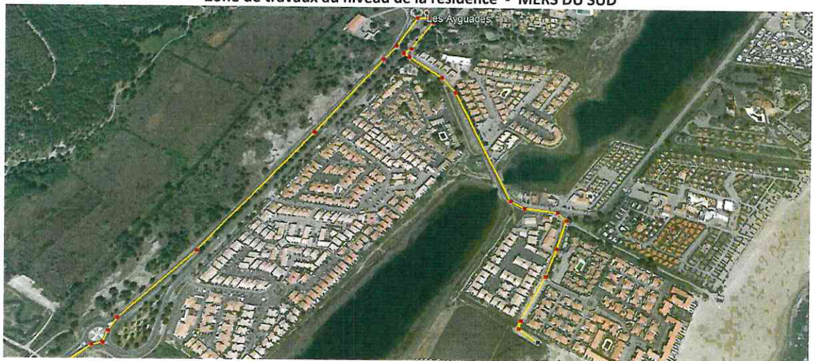
TRAJET UTILISE PAR LES CAMIONS POUR ACCEDER AU CHANTIER