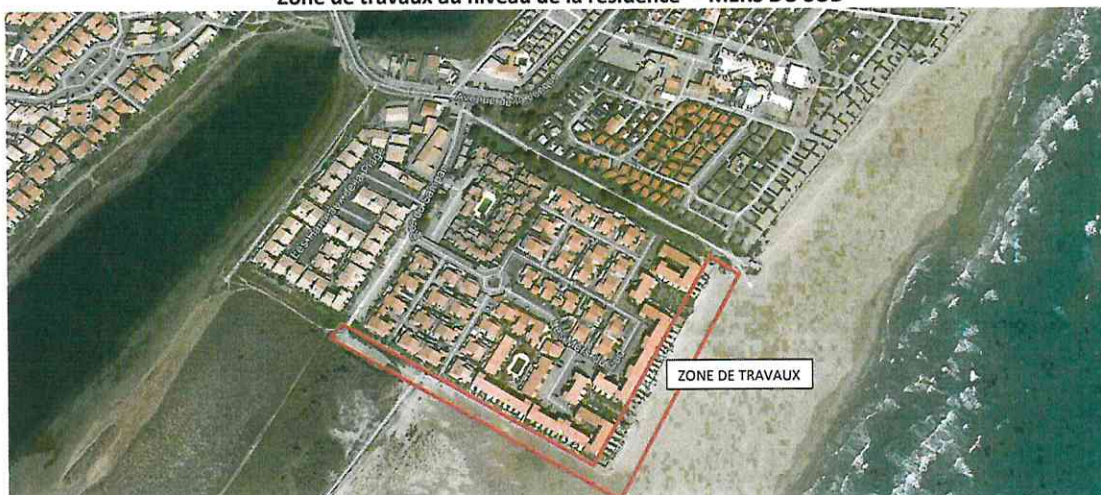
Zone de travaux au niveau de la résidence - MERS DU SUD