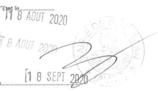
29 AVENUE DU SAUVETAGE, 11430 GRUISSAN