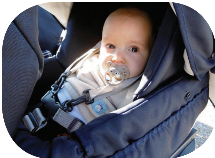
Bébé en promenade