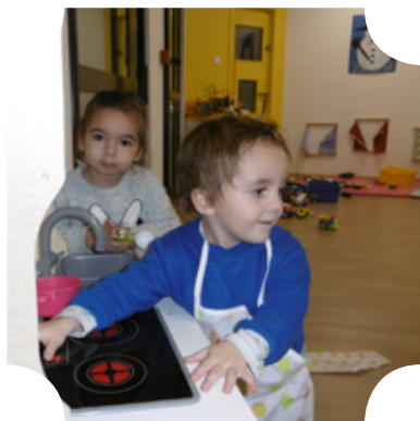
Les petits cuistots