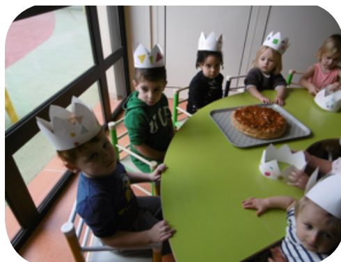
Les rois et reines de la crèche