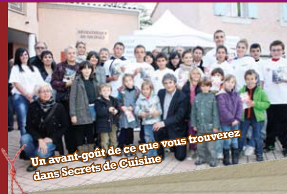
Un avant-goût de ce que vous trouverez dans Secrets de Cuisine

Secrets de Cuisine est disponible à la MJC, aux boutiques Deli d'Oc et galerie d'Intermarché au tarif de 12€. Pour plus d'infos contactez la MJC au 04 68 49 61 87.