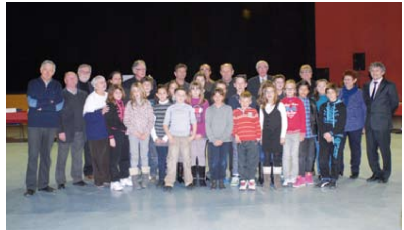
sont félicités d'avoir partagé ce moment unique et pédagogique de Démocratie.

Avant de se quitter, tous les élu(e)s municipaux, enfants et parents se