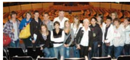
Conseil des Jeunes Voyage en Belgique