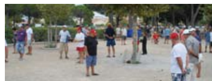
Tournoi de pétanque interquartier