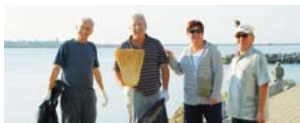
Journée de sensibilisation à la propreté