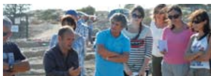
Gruissan, une ville au cœur de son patrimoine