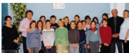
Election du Conseil Municipal des Enfants