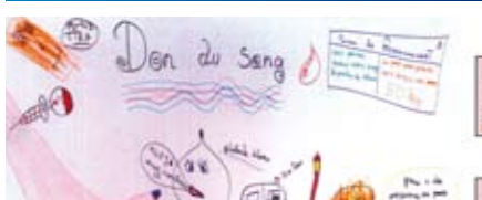
Parution du calendrier 2011 de Gruis'Sang