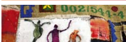
7 artistes confirmés ont exposé peintures et sculptures à Phare Sud