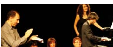
Opéra pour Tous