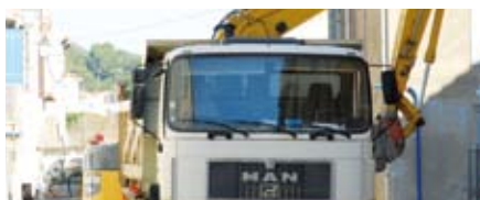
Travaux d'entrée de Village