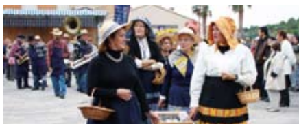
La fête des vendanges