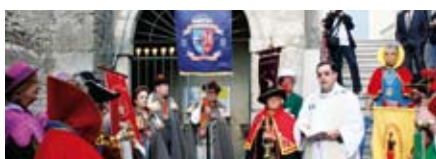
La Confrérie de l'Anguille a célébré son 15 ème Grand Chapitre