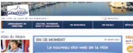
Le nouveau site web de la ville