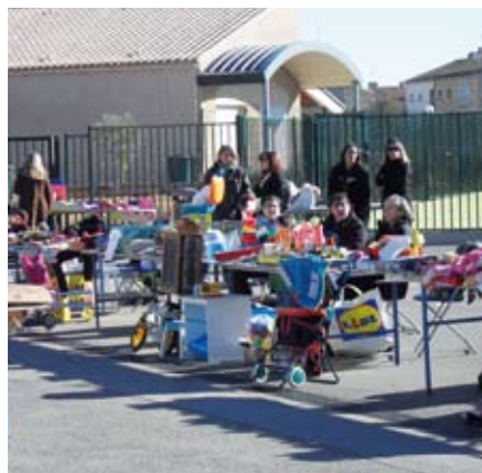
Bourse aux jouets