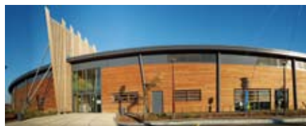
2010, une année charnière entre développement et tourisme durable