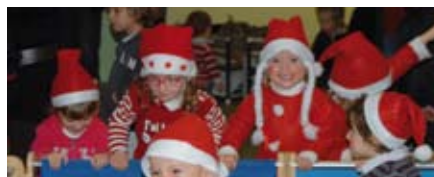
Les enfants fêtent le Père Noël