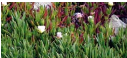
Fleurir oui, mais pas à n'importe quel prix