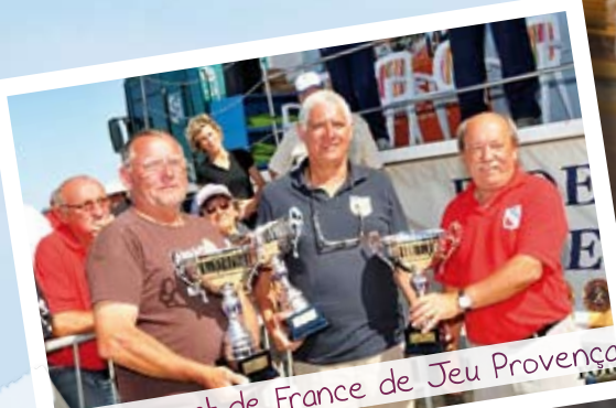
Championnat de France de Jeu Provençal

Cérémonies et magnifique feu d'artifice pour le 14 juillet