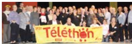
Gruissan se mobilise pour les 25 ans du Téléthon