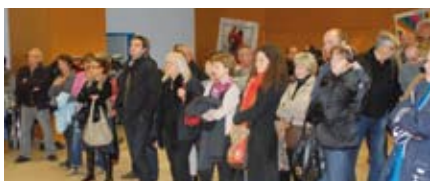
Rencontres cinématographiques de l'Aude