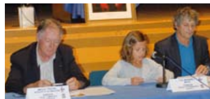
Election du CME