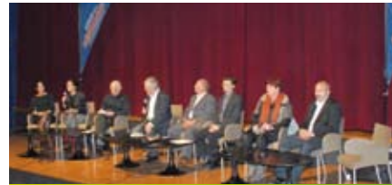
8 ème Forum départemental de la Démocratie