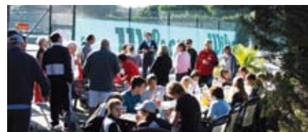
Tennis & Volley