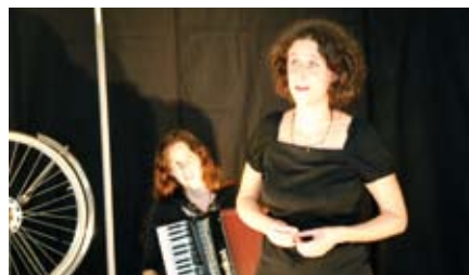
La fête du Conte