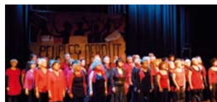
Chorale Chiffon Rouge