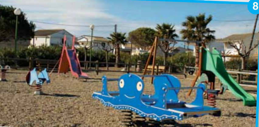
Espace René Anglès Chalets > De plus en plus de familles s'installent aux Chalets, pour un cadre de vie différent. L'aire située non loin des commerces propose de nombreux jeux pour les enfants.