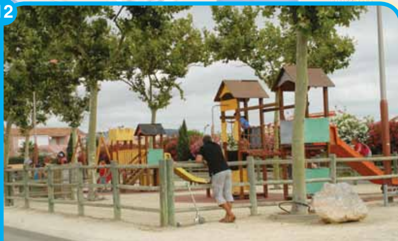
Mateille (rue du Rouget)