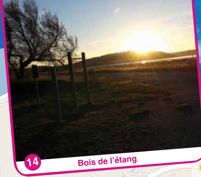
14 Bois de l'étang