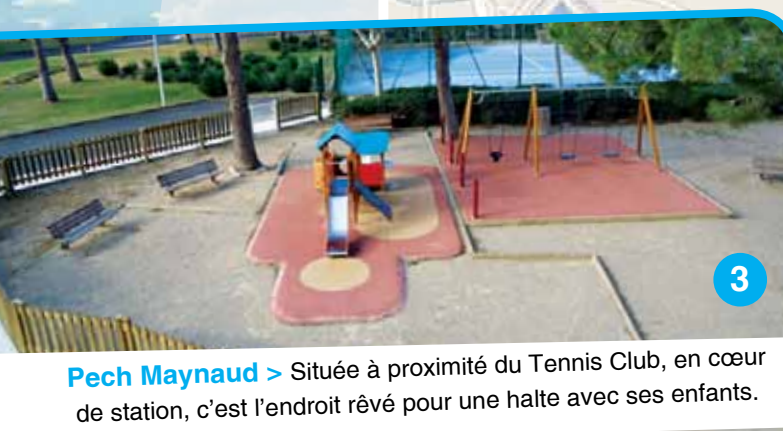
Pech Maynaud > Située à proximité du Tennis Club, en cœur de station, c'est l'endroit rêvé pour une halte avec ses enfants.