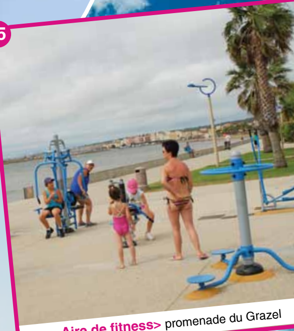
Aire de fitness > promenade du Grazel