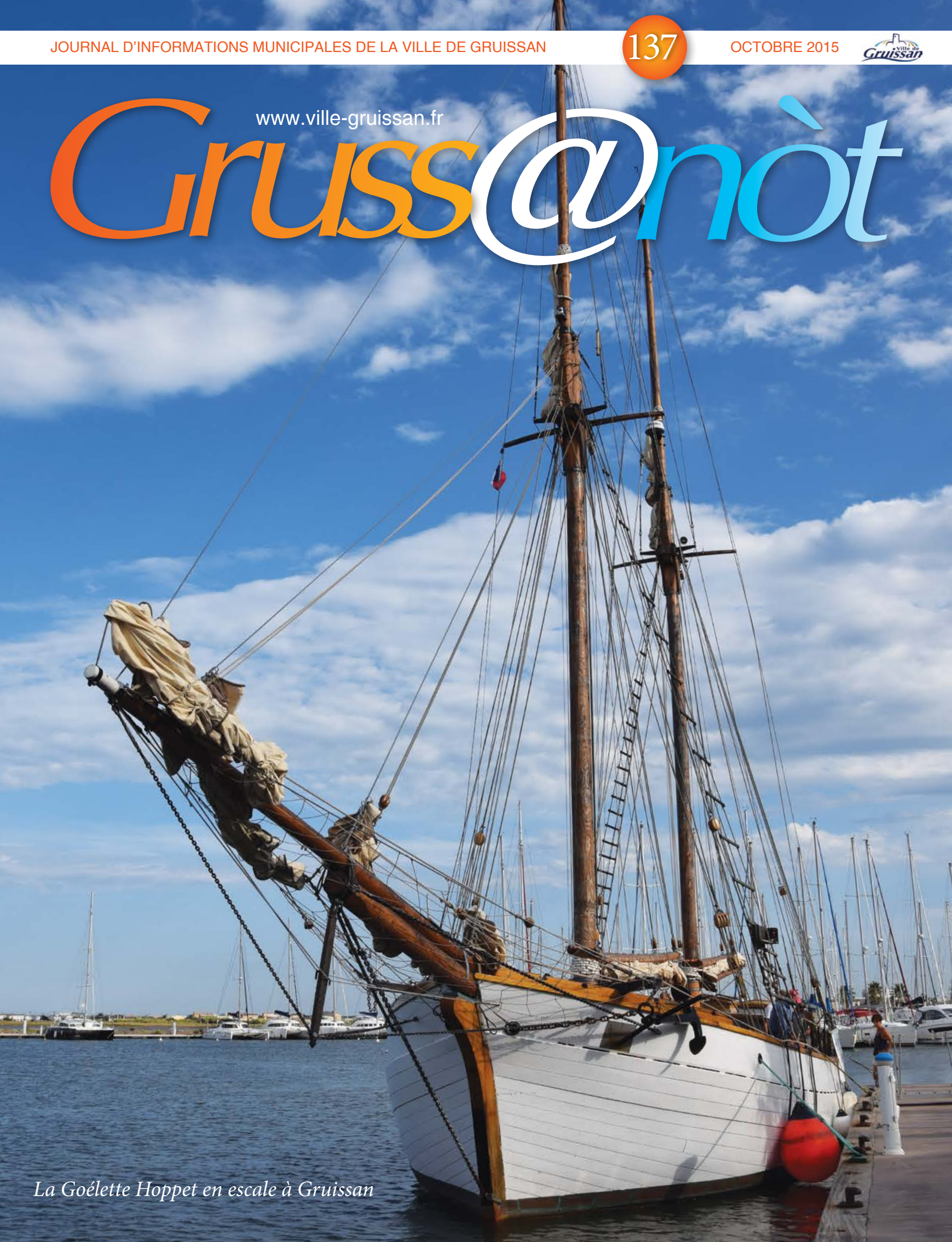
La Goélette Hoppet en escale à Gruissan