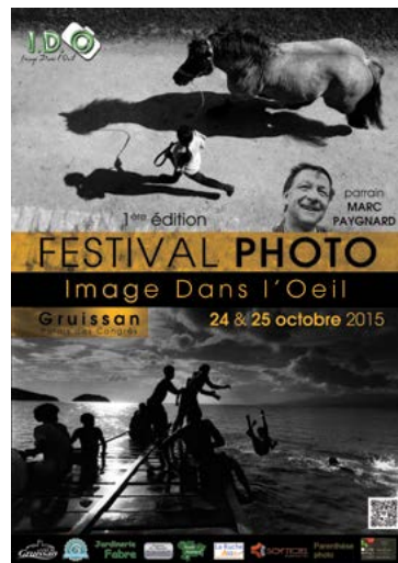
Image Dans l'Oeil 24 et 25 octobre - Palais des Congrès parrainé par Marc Paygnard